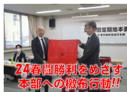
24春闘勝利をめざす本部への檄布行動!!