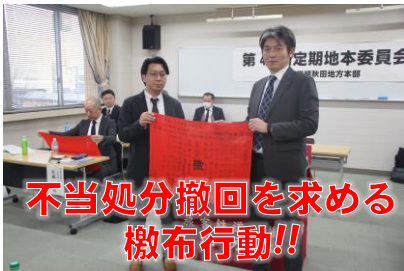
不当処分撤回を求める檄布行動!!