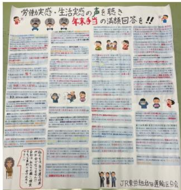
秋田運輸区分会掲示板

・社員の不満や不信感が増える一方であり、離職者や転職を考える社員を多く見てきた。そんな中黒字に転換することができたのは社員の努力の成果であり、満額回答で応えるべきだ！ ・「楽観出来るものではない」「今後の状況次第では再び赤字に転落しかねない」という言葉は使い、賃金や手当を抑えようとすると姿勢はあり得ない！社員を大切にしない会社に未来はない。今後、持続的な成長をしていくためにも黒字転換の為に努力してきた社員の努力に応えるべきだ。 ・「社員の皆さんへ」では水際対策の緩和、全国旅行支援の展開などにより、足元では国内外のお客さま流動の回復が期待されます。とある。黒字化は組合員の努力によるもの。先行きも好調が見通せる中で社員還元するべき！ ・月々の給料なんて生活費に消える。去年は4ヶ月なんですぐなくなつたし、その分もくれないと納得いかない。 ・最近の賑わいで非組合員も冬のボーナス楽しみだと言っていた。この期間の利益に全く反映されない額だったらすすがに非組合員に不信感持たれるなど会社は思つてそう。