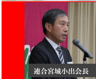
連合宮城小出会長