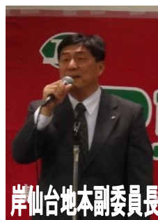
岸仙台地本副委員長

大抽選会も行われ、当選者からは年の初めから縁起がいいとの声も上がり、大いに盛り上がり盛がりのうちに旗開きは大成功に終了しました。