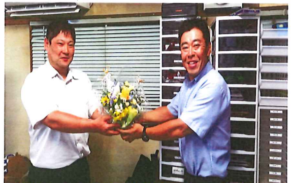
退任された園部委員長(写真左) これまで大変お疲れさまでした。

18春闘に対する闘いでは多くの皆さんにご迷惑をお掛けし、申し訳ありませんでした。厳しいたたかいではありますが、職場の一人一人の声を元に運動を創り出していきます。